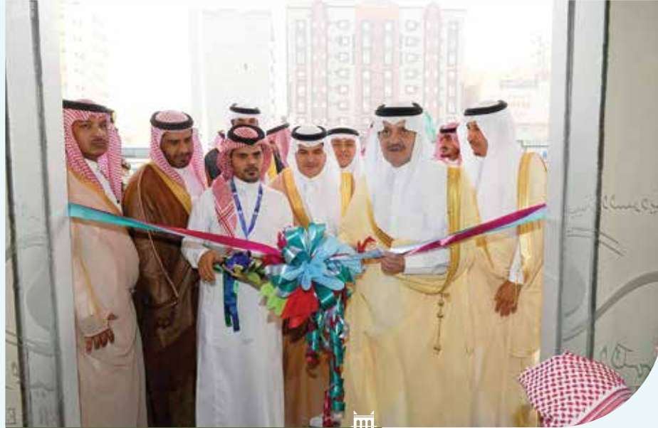
أمير الشرقية يفتتح عددا من مشروعات المياه بمحافظة الجبيل

كما كان للجانب السياحي بالمحافظة نصيب أيضًا، حيث تم استلام مشروع توريد وتركيب نظام إنتاج للمياه الصالحة للشرب بجزيرة جنة بقيمة ٩٥٠ ألف ريال،