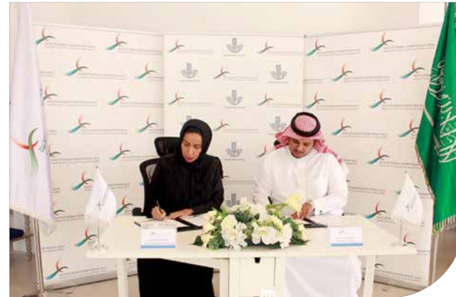
توقيع مذكرة تفاهم بين مجلس المسؤولية الاجتماعية وأمانة الشرقية

ونشر ثقافة المسؤولية الاجتماعية، من خلال إعداد سفراء متميزين في المسؤولية الاجتماعية بالقطاعات الثلاثة: الحكومي، والخاص، والقطاع الثالث بالمنطقة الشرقية؛ لتحقيق مبادئ المواطنة الصالحة والفاعلة لخدمة المجتمع، كما يهدف المشروع إلى بناء شبكة من سفراء المسؤولية الاجتماعية بالمنطقة الشرقية؛ لإعداد مجموعة من الأفراد القادرين على المساهمة في تلبية احتياجات المجتمع.