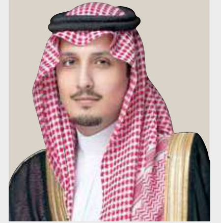
الأمير أحمد بن فهد