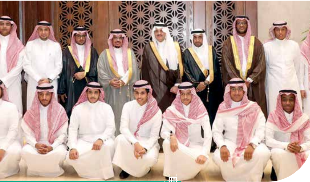
أمير الشرقية يستضيف الفرق التطوعية بالمنطقة في مجلس «الإثنيينية»

كما لاقى فريق البحث والإنقاذ التطوعي التابع لجمعية العمل التطوعي بالمنطقة الشرقية، والذين استضافهم سموه في لقاء الإثنيينية الأسبوعي بمقر ديوان الإمارة، الاهتمام والتشجيع، حيث أكد سموه أن هذا الفريق تميّز بالأعمال التطوعية التي لا يرجون من ورائها إلا الأجر والثواب من الله «سبحانه وتعالى» أولاً، ثم خدمة لوطنهم ومجتمعهم، مشيراً سموه إلى سير هذا الفريق في الطريق السليم الذي رسمه قائد هذه المسيرة سيدي خادم الحرمين الشريفين «أيّده الله»، ودعمه أخي