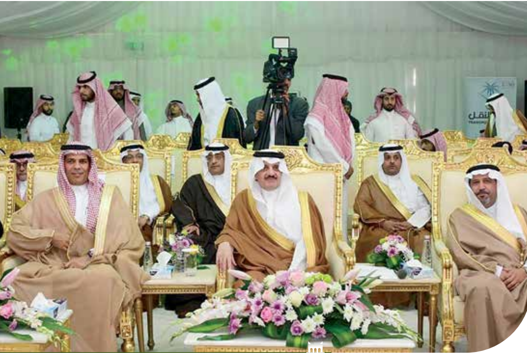
الأمير سعود بن نايف خلال تدشينه عدداً من مشاريع الطرق بالمنطقة الشرقية

وشملت المشروعات التي تزيد تكلفتها على ١.٥ مليار ريال، تنفيذ تقاطع مدخل قرية الوزية على طريق الهفوف - بقيق، بطول يبلغ ١.٣ كلم، وتقاطع رقم ٣ ضمن مشروع استكمال الأعمال التكميلية للطريق الدائري بالأحساء (الضلع الجنوبي والشرقي والشمال) والمتضمن طريق خدمة، و ٧ تقاطعات (المرحلة الأولى) بطول يبلغ ٧ كلم. وفيما يخص مناطق تنفيذ الـ ٣٧