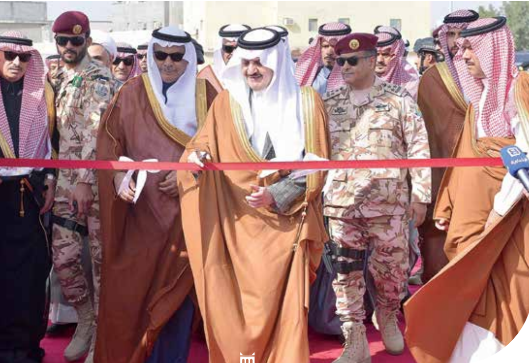
الأمير سعود بن نايف أثناء افتتاحه مشروع وسط العوامية

يُعتبر مشروع تطوير وسط العوامية جوهرة من جواهر فنون العمارة التراثية بمنطقة القطيف، بأبراجه العالية، والبيت التراثي وساحاته الفسيحة، وأسواقه الشعبية، وعدد من المعالم التي تُعيد إلى الأذهان الكثير من الذكريات لسكان القطيف