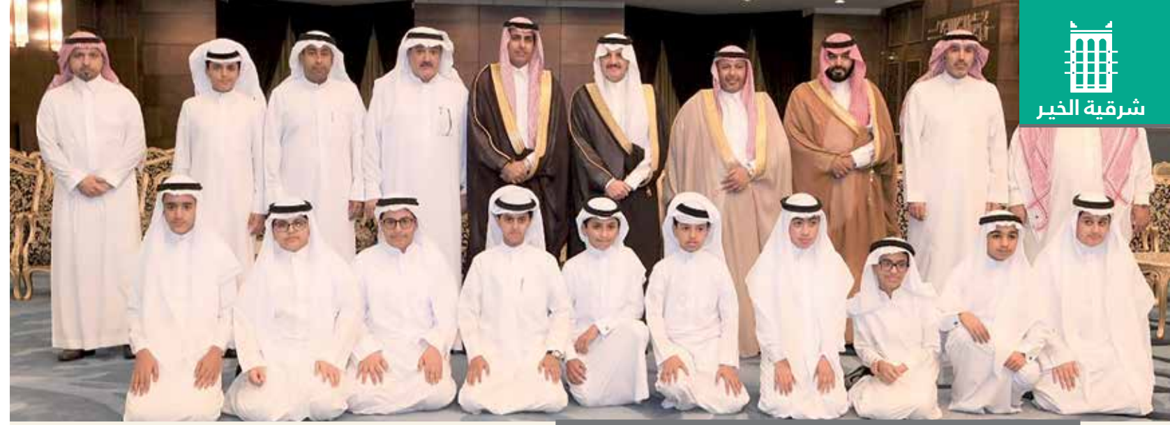
استشعاراً لأهمية الشباب.. عماد المستقبل

ولا شك في أننا بالمنطقة الشرقية نحظى باهتمام كبير، وتوجهات مستمرة من لدن أمير المنطقة الشرقية صاحب السمو الملكي الأمير سعود بن نايف بن عبدالعزيز،