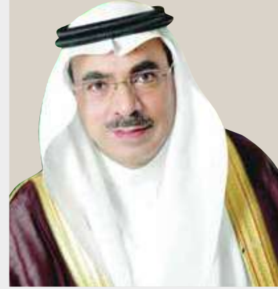
م. فهد بن محمد الجبير

ولا أنسى هنا الدعم الكبير من لدن صاحب السمو الملكي أمير المنطقة الشرقية الأمير سعود بن نايف «يحفظه الله»، وكذلك