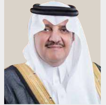
الأمير سعود بن نايف