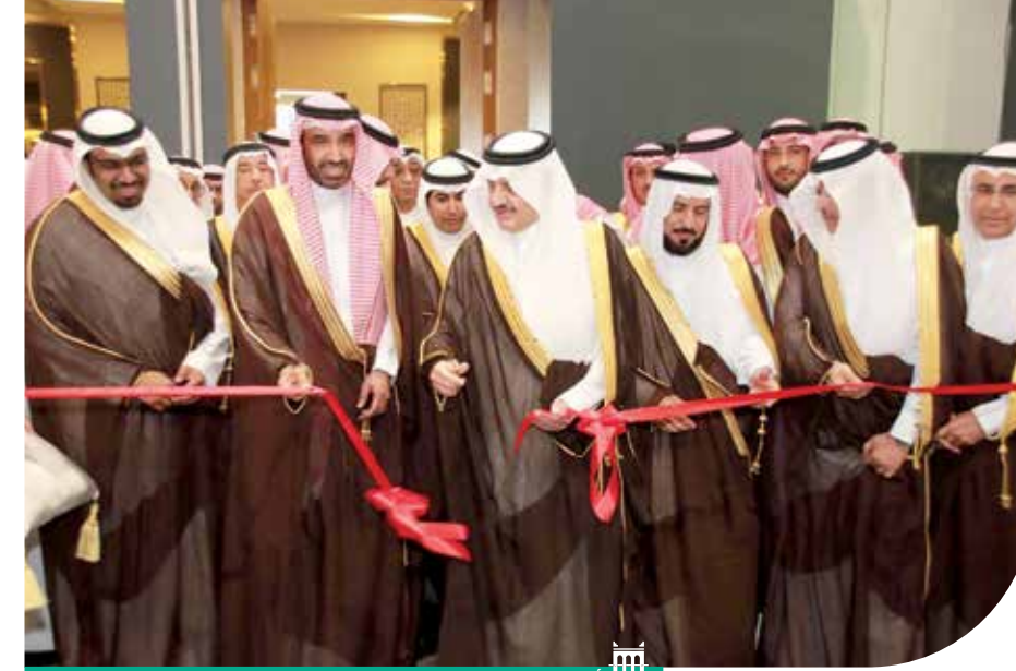
أمير الشرقية خلال تدشين معرض وملقى «راد» لريادة الأعمال 2019