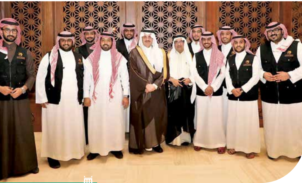
استقبال فريق السكب التطوعي

والقوانين، بالإضافة إلى مساعدة أفراد الفريق المتطوعين لإدارة الدفاع المدني في كل عمليات البحث والإنقاذ. ويضم الفريق عدداً من المتطوعين المتخصصين من طلاب أطباء ومهندسين؛ وممرضين ومسعفين، وموظفي قطاع حكومي، وقطاع خاص.