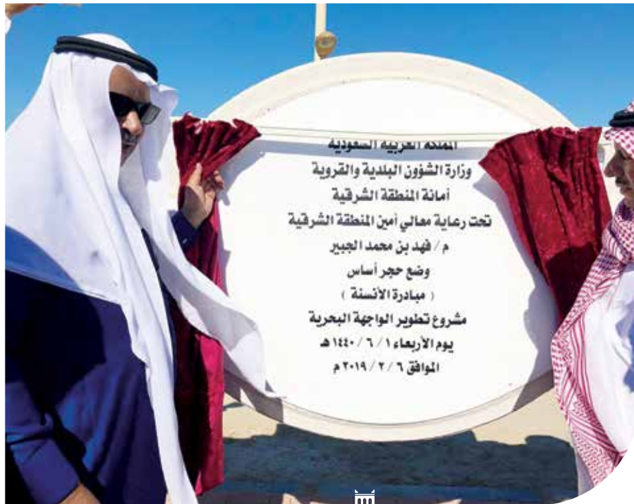
م. فهد الجبير خلال تدشينه مشاريع تنموية في محافظة الخفجي

تدشين قسم الطوارئ الجديد بمستشفى الخفجي العام، حيث بلغت قيمة إنشاء المبنى 5 ملايين ريال، فيما بلغت قيمة الأجهزة والمعدات الطبية والتجهيزات داخل الأقسام 10 ملايين ريال