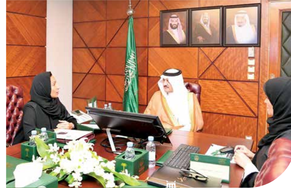
سمو أمير الشرقية يستقبل أمين عام مجلس المسؤولية الاجتماعية