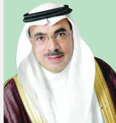
م. فهد بن محمد الجبير

تمر الذكرى الـ٩٠ لليوم الوطني للمملكة العربية السعودية، وهي قائمة على دعائم ثابتة ومتينة، تتحدى تقلبات الزمن، وتزداد رسوخاً واعتزازاً على مرّ الأجيال، بهذا الرصيد العريق، وبأمجاده ومكتسباته التاريخية؛ ليبقى هذا الإرث حياً في ذاكرة الأجيال المتعاقبة، تنهل منه معاني الوفاء للوطن دون سواه.