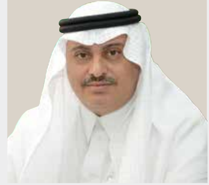
محمد بن عبدالعزيز الصفيان

إن اليوم الوطني للمملكة العربية السعودية مناسبة عزيزة، تجسّد معنى الحرص على استمرار الرقي والازدهار بالمجتمع السعودي إلى ما يتطلع إليه في كل المجالات. وإننا نعيش نهضة حضارية في جميع الميادين، في ظل هذا العهد المبارك، عهد خادم الحرمين الشريفين الملك سلمان بن عبدالعزيز آل سعود، وسمو ولي عهده الأمين الأمير محمد بن سلمان بن عبدالعزيز «يحفظهما الله»، هذا العصر المبارك الذي شهد نقلة نوعية وتطوراً في مجالات التنمية على أسس قوامها الإرادة القوية، والتصميم المدعوم بالمقدرة على ترجمة الآمال إلى منجزات محسوسة.